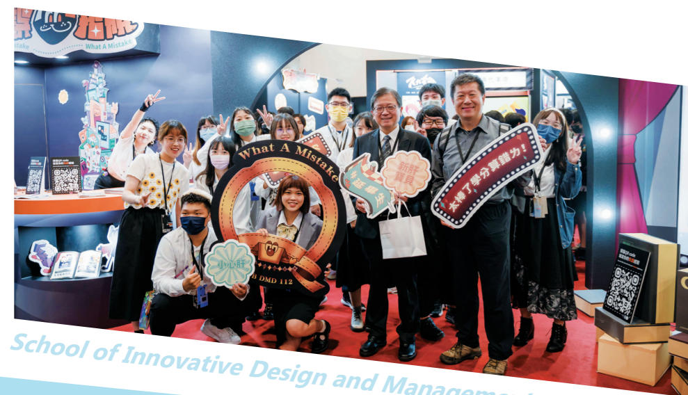
School of Innovative Design and Management