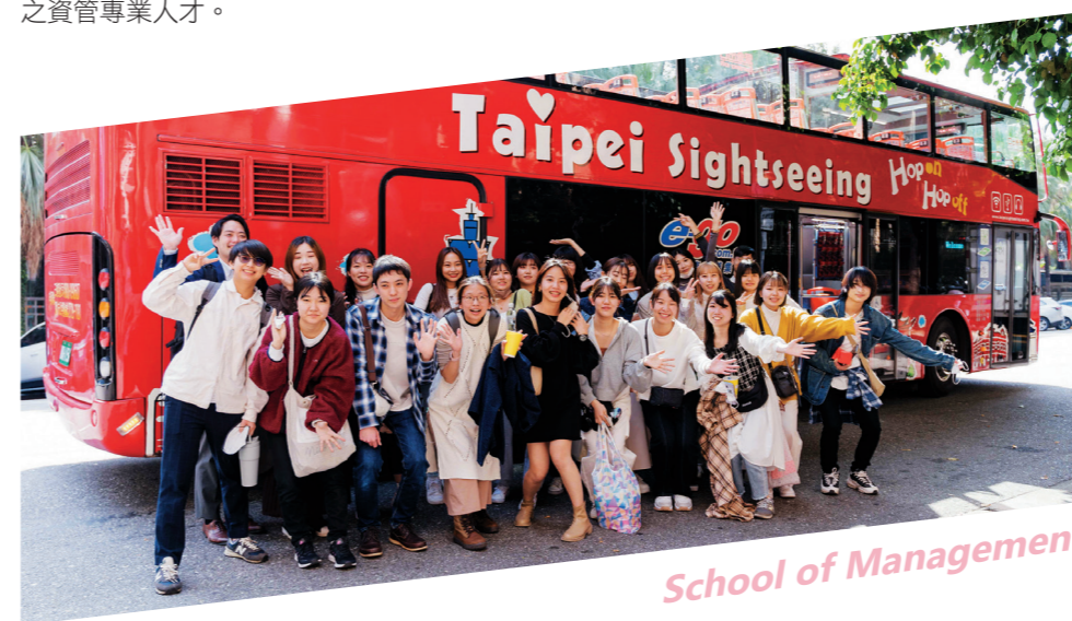
School of Management

本所以「AI科技」以及「數據分析」為基礎，「創新」及「商業」為專長領域之教學特色。課程理論與實務並重，培養具產業數位轉型與跨域整合之數位科技創新與經營決策人才。